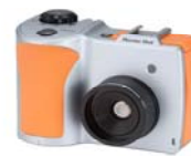
F30W F30S F20