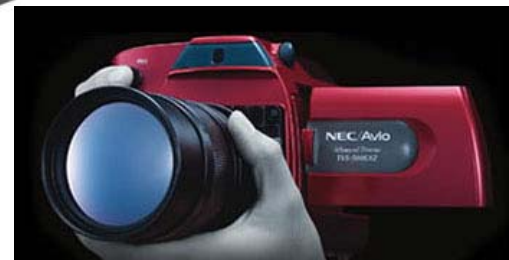
写真:サーモレーサ TH9260(左)、アドバンストサーモ TVS-500EXZ(右)