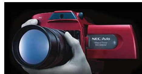
写真:サーモレーサ H2640(左)、アドバンスドサーモ TVS-500EXZ(右)