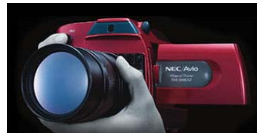
写真: サーマトレーサ H2640(左)、アドバンストサーモ TVS-500EXZ(右)