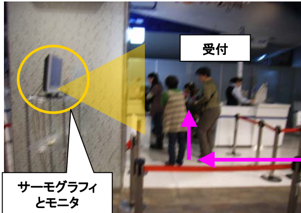
サーモグラフィとモニター