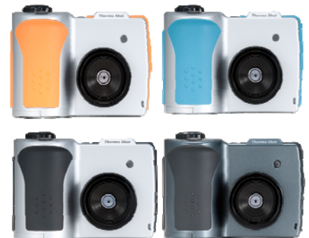
サーモグラフィ Thermo Shot F30シリーズ

空港・港湾の検疫所、病院、公共施設、企業の受付窓口、アミューズメント施設などに設置することにより、発熱者の早期発見に活用できます。