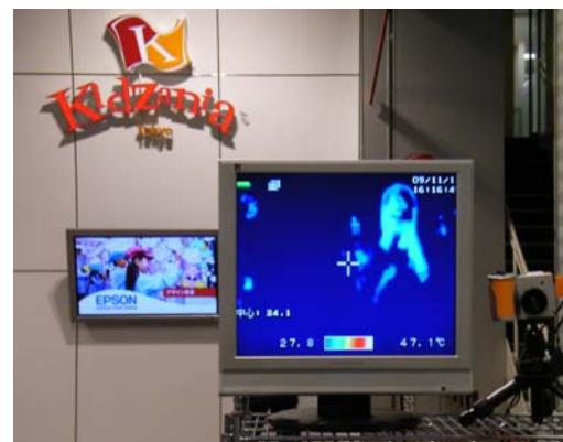
入口に設置されたサーモグラフィ

しかし、万が一入場後にお客様が発熱して倒れた場合は、救護室もしくは指定病院に搬送する体制が整っています。