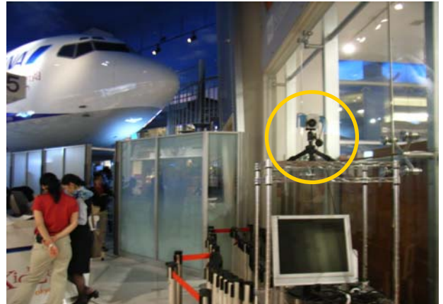
団体客用の入口に設置されたサーモグラフィ