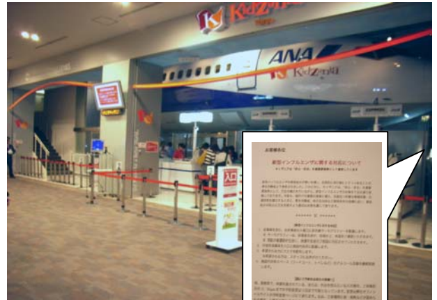
新型インフルエンザ対策に関する貼り紙