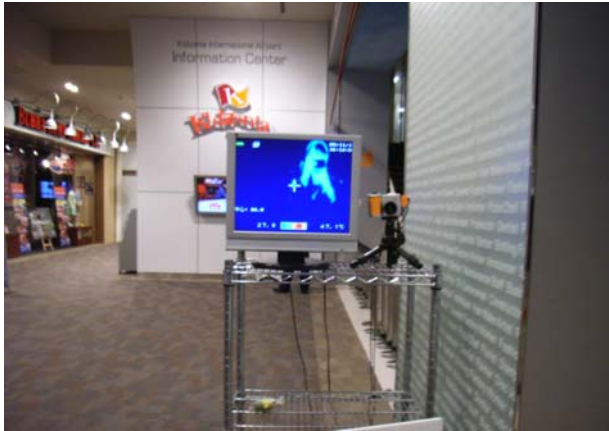
サーモグラフィに映る人物